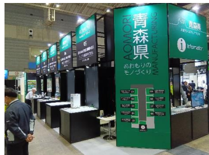
参考:テクニカルショウヨコハマ2024 青森県ブース